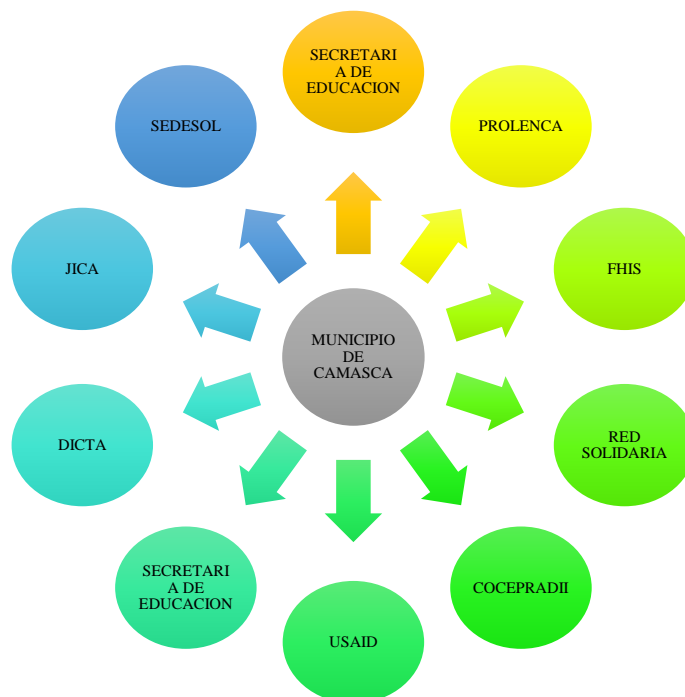
Figura 1. Actores que participan en procesos de Seguridad Alimentaria y Nutricional en el municipio de Camasca, Intibucá. Honduras. 2018.

actores externos, los cuales en la actualidad están llevando a cabo diversos proyectos enfocados en la implementación de acciones que den atención a los problemas que afectan a la población vulnerable (Figura 1).